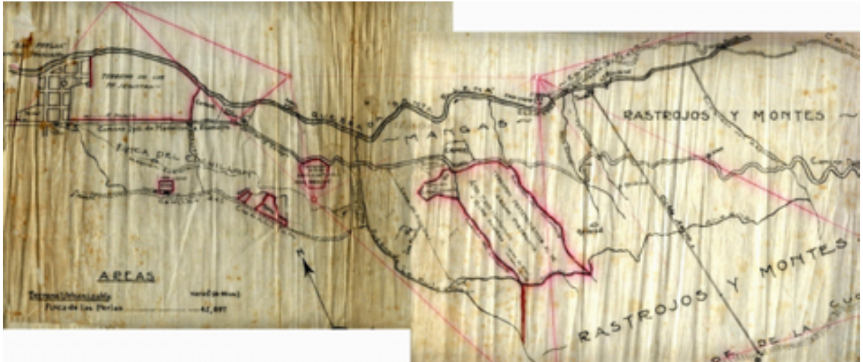
Mapa núm. 4.

Fragmento de reproducción del plano de las fincas El Cuchillón, Las Perlas y Santa Elena, propiedad de la sucesión Amador. Aparece claramente indicado una porción del Camino Departamental de Medellín a Rionegro, desde la Puerta Inglesa a la salida de la ciudad, hasta poco después de superar la Quebrada del Espadero en inmediaciones del sitio del Cauce, donde se intercepta con el Camino Viejo. El Camino Viejo aparece en líneas pespunteadas, pasa la quebrada Santa Elena en el Salto de Bocaná, posteriormente asciende para encontrar el Camino Departamental. También se observa el camino del Cuchillón, camino de fracción. Están señalados igualmente los "ojos de sal", donde se extraía la sal para alimentación de animales, el trayecto del cable aéreo, la acequia y la quebradas Santa Elena, El Carbonero, El Chupadero y El Espadero. Levantamiento realizado por el Ingeniero Civil Germán Serna, Medellín, julio de 1920.