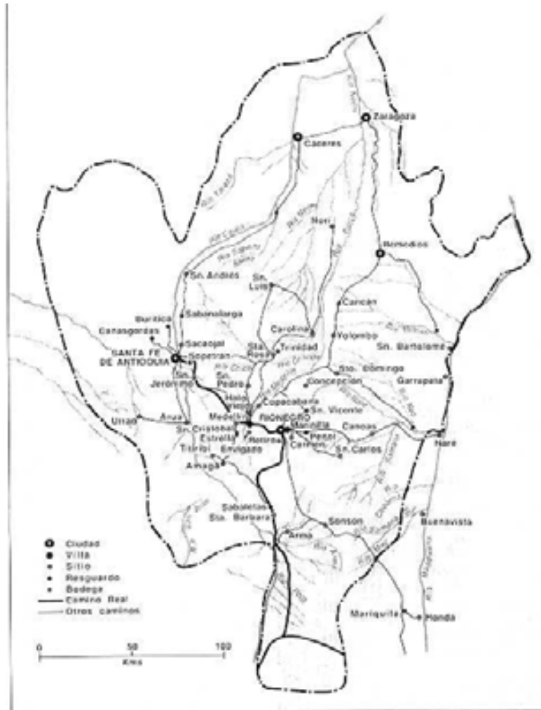
Mapa núm. 1.